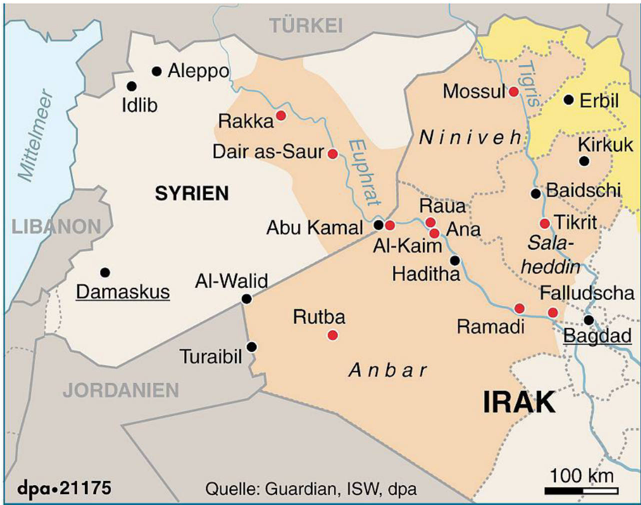
Abbildung 2: Terrormiliz ISIS auf dem Vormarsch, Stand 23.06.2014

Doch wie verhält sich denn nun die US-amerikanische Regierung zu all diesen Problemen, die durch die Invasion im Irak aus dem Jahre 2003 erst entstanden sind?