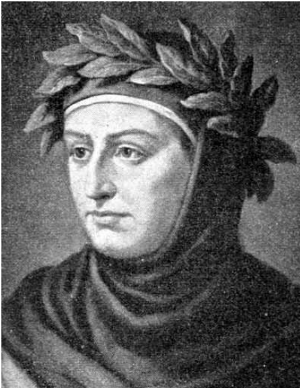
Abbildung 2: Giovanni Boccaccio, Bibliothek des allgemeinen und praktischen Wissens. Bd. 5" (1905), Abriß der Weltliteratur, Seite 65

Man kann also zu der Einschätzung gelangen, dass die Ideen des Humanismus einen politiktheoretischen und gesellschaftstheoretischen Wendepunkt markierten, der letztlich das Zeitalter der Aufklärung erst ermöglichte.