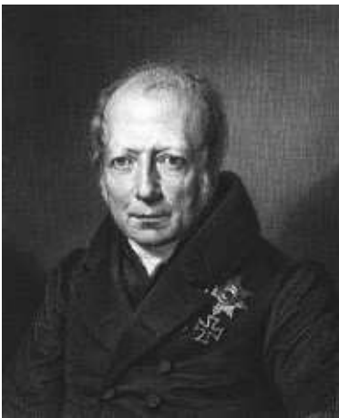
Abbildung 4: Wilhelm v.

Damit hat die humanistische Weltanschauung weiten Einfluss auf die Gesellschaft ausgeübt und zu einer Veränderung der sozialen Realität geführt: in der Wissenschaft, der Schule und der Universität, in den Religionen, den Künsten und im alltäglichen Leben.