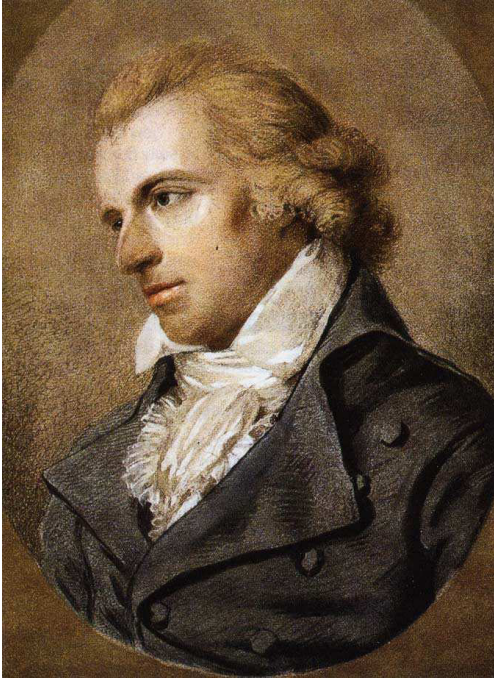
Abbildung 8: Friedrich Schiller;