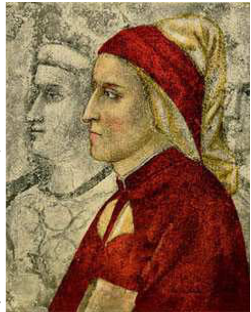
Abbildung 1: Dante Alighieri, Gemälde von Giotto di Bondone in der Kapelle des Bargello-Palasts in Florenz, Quelle:

„Humanistische Ansätze fanden sich bereits mit der Rezeption des griechischen Menschenbilds im Rom, insbesondere bei Cicero. Erst mit dem veränderten Selbstverständnis des Menschen am Ausgang des europäischen Mittelalters knüpften in Italien Dante Alighieri, G. Boccaccio und F. Petrarca ab Mitte des 14. Jh. wieder an die Literatur und Werte der römischen Antike an. Nach der Eroberung Konstantinopels (1453) durch die osmanischen Türken zogen viele byzantinische Gelehrte nach Italien und verstärkten das Interesse an griechischer Literatur, die zum Vorbild einer antike Formen nachahmenden Dichtung in lateinischer Sprache wurde. Mittelpunkt des italienischen Humanismus war der Hof der Medici in Florenz, seine Hauptvertreter der spätere Papst Pius II., Kardinal P. Bembo, L. Valla und N. Machiavelli. Der Humanismus interpretierte das Christentum neu: G. Pico della Mirandola entwarf in seiner »Rede über die Würde des Menschen« (1486) das Bild eines von Gott mit unendlicher Freiheit ausgestatteten Menschen, der Schöpfer seiner selbst sei.“ 2