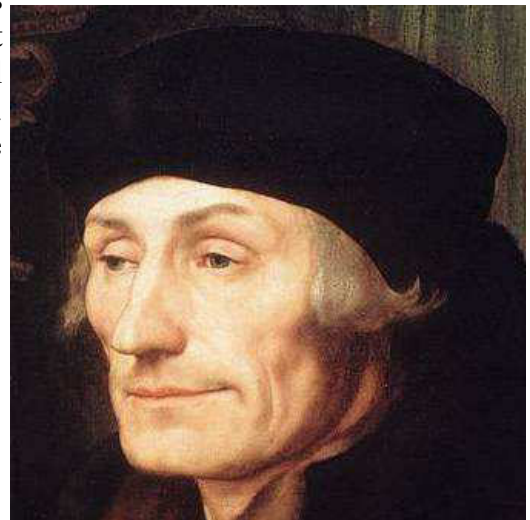
Abbildung 7: Erasmus von Rotterdam,

„Schon in der Antike gab es humanistische Strömungen. Im 14. und 15. Jahrhundert war der Humanismus dann eine Bewegung in vielen europäischen Ländern. Ein früherer Vertreter war Nikolaus von Kues ( Cusanus ; 1401–1464), er war Bischof von Brixen. Einer der berühmtesten Humanisten überhaupt war Erasmus von Rotterdam (1465(?)–1536). Bekannte Humanisten des 18. Jahrhunderts waren u.a. Johann Gottfried Herder (1744–1803; Auch eine Philosophie der Geschichte zur Bildung der Menschheit , 1774) und Friedrich Schiller (1759–1805; Über die ästhetische Erziehung des Menschen , 1795).