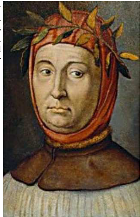
Abbildung 3: Francesco Petrarca (1304-1374)

Als Epochenbegriff markiert der Humanismus zusammen mit der Renaissance den Übergang vom Mittelalter zur Neuzeit (auch »Renaissance-Humanismus«). Auf der Basis einer intensiven Beschäftigung mit der antiken Literatur sowie mit Sprache, Geschichte und Moralphilosophie überwand er die auf den christlichen Glauben fixierte mittelalterliche Philosophie (Scholastik). Von Italien ausgehend, verbreitete sich der Humanismus zwischen dem 14. Jahrhundert und 16. Jahrhundert in ganz Europa; als Bildungs- und volkssprachliche Bewegung profitierte er von der Erfindung des Buchdrucks.“ 3